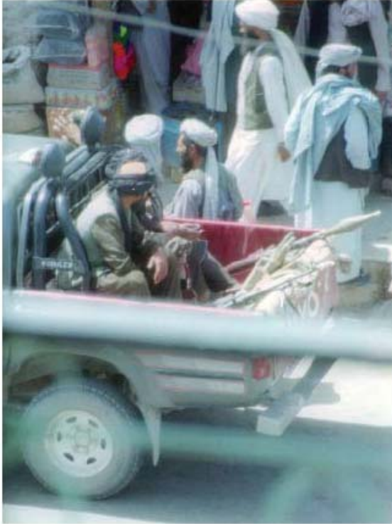
Taliban u Heratu u Afganistanu, za vrijeme njihove vladavine od 1994. do 2001. Oni nisu ni u kojem smislu domorodna pojav. U stvari nitko u Afganistanu nije ikada čuo o takvoj skupini u prošlosti.

S islamskom zastavom u svojim rukama i pakistanskim vojnicima koji su pružali potporu svojom borbenom silom, taliban je ubrzo preplavio većinu Afganistana, ali ne sve. Između 1995. i 2001., kad su specijalne jedinice Sjedinjenih Država ušle iz Uzbekistana, talibanska vlast izgubila je svoj zamah. Jednom snaga koja je spajala sve usred pohlepnih, vlašću opsjednutih mudžahedinskih vođa, taliban, nakon što je došao na vlast, izgubio je vrlo brzo svoju vjerodostojnost. Izvještaji ukazuju da ne više od 5% Afganistanaca u 2001.g. još uvijek podupire te fanatike.