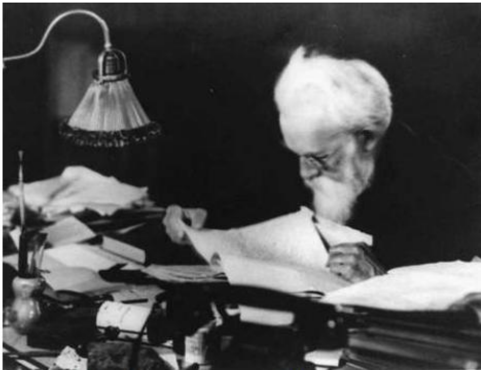
Akademik V.I. Vernadski (na slici), zajedno s Planckom i Einsteinom bili su vodeći intelektualni divovi 20. stoljeća, a taj su položaj postigli svojom odanosti otkrića zakonitosti usađenih u jedinstvena svojstva rada Bernharda Riemanna.

Taj je predmet već postao, u zadnje vrijeme, predmetom sve veće i češće pozornosti među osobama kao što su članovi naše „Podrumske ekipe“.