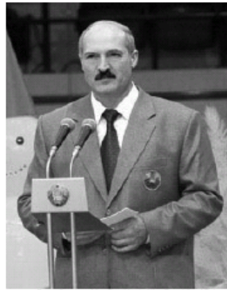
Predsjednik Aleksander Lukašenko ponovno je izabran 19. ožujka s nadmoćnim mandatom od 82,6% glasova—na užas washingtonskih neo-kona, kojima nije uspjelo raspirati pobunu protiv njega.