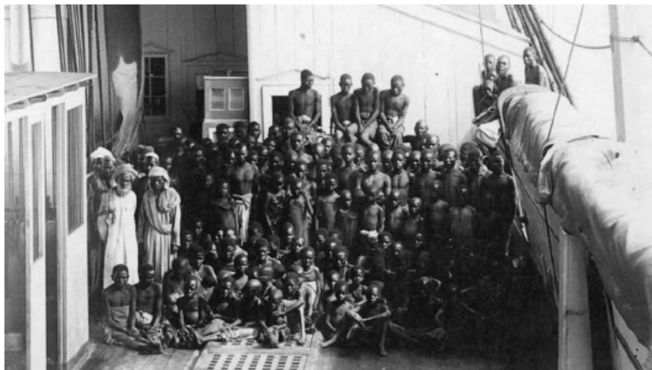
Ekonomski model britanske Istočno-indijske tvrtke bio je nametnuti globalni sustav kolonijalne pljačke, koja je prozročila višestruke pojave pomora gladu u Indiji i drugdje. Na slici trgovina robljem preko Indijskog oceana.

Sad, hrane nema. To je posljedica namjerne „politike svjetske tržišne ovisnosti“, čija nakana je genocid.