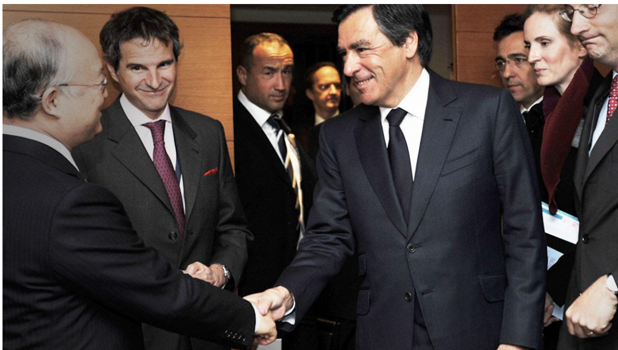
Nekadašnji premijer Francuske, Mr. François Fillon susreće se s Yukiya Amanom, glavnim direktorom IAEAe i Mr. Rafaelom Grossijem, šefom kabineta.

Nadmoćna početna izborna pobjeda François Filliona za predsjedničkog kandidata Republikanske stranke Francuske na nedjeljnim stranačkim izborima daljnji je dokaz da ratni poriv Baracka Obame protiv Rusije nije više podnošljiv za ljudski rod. Kao Hillary Clinton, Fillionov protivnik vodio je kampanju protiv Rusije, dok je Fillionova kampanja isticala rad s Rusijom na porazu terorista u Siriji, za okončanje proturuskih sankcija i proširenje ekonomske suradnje, i time dobio skoro dvije trećine glasova.