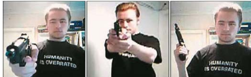
ČOVJEČANSTVO JE PRECIJENJENO – napis na majici

U našoj obradi tog slučaja ovdje ne radi se o krivici ili relativnoj nevinosti bilo kojeg sudionika u tom groznom događaju. U našu svrhu odsudne su, kao i u mnogim očigledno sličnim slučajevima, okolnosti pod kojima se sve dokazljivo dogodilo i kako o tome donose izvješća. Odsudan je prevladavajući potencijal (t.j. opasnost) od dinamike čiji je aktualna situacija bila izražaj.