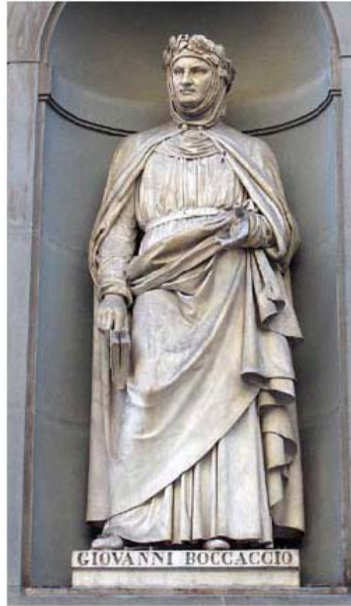
Kip Giovanni Boccaccija (1313. – 1375.) u Firenci. Pjesnikov Decameron predstavlja priče, koje daju tipične prilike razdoblja Europe u Novom mračnom vijeku 14. stoljeća.

ljudski mozak], (New Haven: Yale University Press 1958), s Oscarom Morgensternom, The Theory of Games & Economic Behaviour [Teorija igara i ekonomsko ponašanje], 3. izdanje (Princeton, N.J.: Princeton University Press, 1953). I Wiener i von Neumann bili su poklonici Bertranda Russella, naročito Russellove Principia Mathematica , Alfred N. Whitehead and Bertrand Russell Principia Mathematica Cambridge: Cambridge University Press, 1994., ponovljeni tisak izdanja iz 1927.), a obojicu je David Hilbert, u različito vrijeme, izbacio iz Göttingenskog sveučilišta na osnovu dobro utemeljenih optužbi za trajnu nekompetentnost, te u slučaju von Neumanna za dodatnu još goru optužbu plagijata.