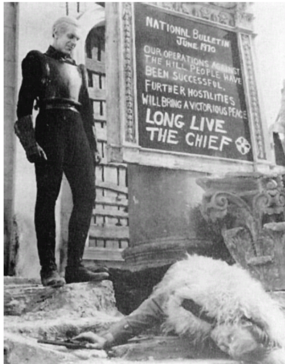
Britanski politički sustav stigao je do točke daleko van dosega svakog mogućeg izlječenja djelovanjem unutar samog sustava. Basne kao rad zakletog faiste H.G. Wellsa "Ono što dolazi" samo trate vrijeme do dolaska poslovične „Smrti s kosom u ruci“. Na slici: Raymond Massey u sceni iz filma.

kosom u ruci“ ne stigne, kao avet na pr. u ulozi koju je veoma proročki glumio Raymond Massey u drami Things to Come [Ono što dolazi] zakletog britanskog fašiste H.G. Wellsa—rani kraj daljnjeg postojanja samog sadašnjeg britanskog političkog sustava.