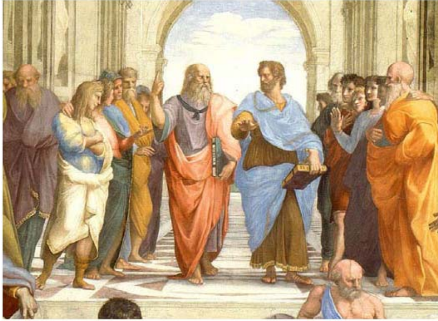
Rafaelova "Atenska škola (1509.-1510.) prikazuje "besmrtni sukob" republikanske koncepcije Čovjeka (Platon – sredina- lijevo) i oligarhijskog načela (Aristotel, sredina- desno), gdje taj sukob traje već milenijima.

To nam je razvidno kad ispitujemo znanost s naročito podesnog stajališta kojeg, u fizikalnoj znanosti, predstavlja slijed Talesa, Heraklita, Pitagorejaca i Platona. Kad uzmemo također u obzir revolucije primjene tehnike, koje su skupina učinaka čiji odraz vidimo u sadašnjem načinu života, onda raspoznavamo da društvo reagira na te stečevine znanja i okolnosti i metode primjene u životu, i to čini na način koji ustvari znači da mi živi djelujemo na osnovi umova oblikovanih okolnostima koje su naši prethodnici stvorili.