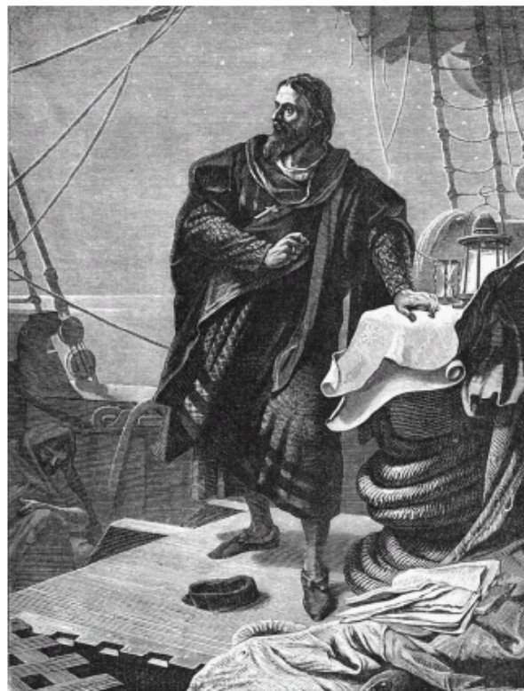
Prou veliku plovidbu otkrića 1492. g Kristofer Kolumbo je razradio na osnovu tradicije Zemljinih mjerenja drevnog Eratostena, a krugovi oko kardinala Nikole Kuzanskog to su znanje oživjeli i obogatili.

Suprotno uglavnom glupavoj dogmi početka civilizacije uz riječne obale, stvarni neto napredak ljudske kulture u cjelini imao je središte, preko stotine tisuća godina i više, u razvoju tih preoceanskih pomorskih kultura, s osnovicom u razvoju primjene astrogacije, te se preselio u stalna obalna pomorska naselja, kao u Sumeriji, a zatim je prenosio civilizaciju uzvodno uz rijeke u unutrašnjost. To je bio proces, koji je odredio prednost pomorskih kultura pred onima u zemljama bez izlaza na more, sve dok