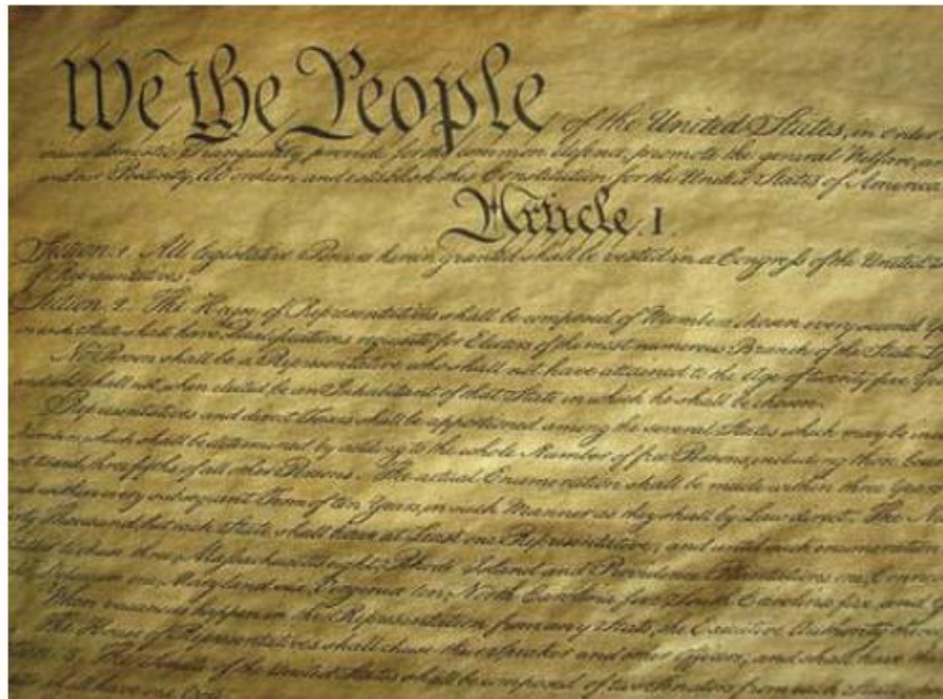
Srž privrženosti Ustava SADa Dobrobiti, i obveze Kongresa osigurati ih, nalaze se u Predgovoru i Članu 1 Sekcije 8 tog dokumenta, gdje je Alexander Hamilton igrao odlučujuću ulogu pri njegovom oblikovanju i ratifikaciji.

Nakon Konvencije, naravno, nitko se nije sukobljavao javno, glede ratifikacije Ustava, više od, ili oštrije od Hamiltona koji je napisao 51 od