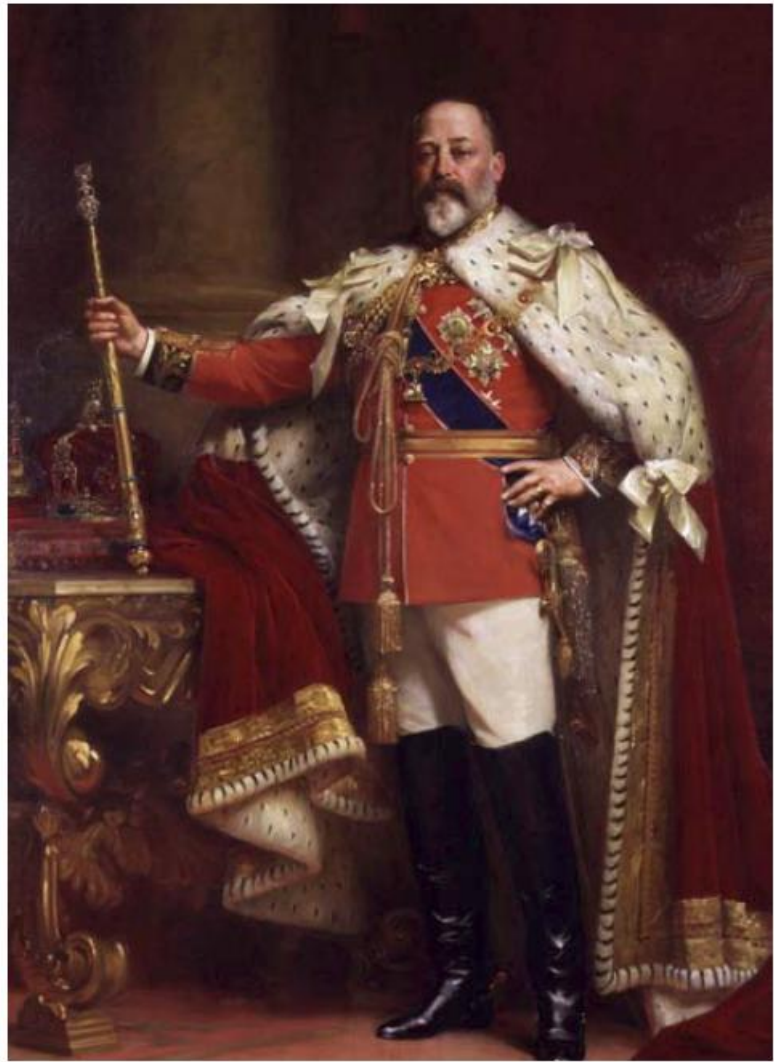
Britanski kralj Edward VII je krivac za 1. svjetski rat između ostalih tragedija. Bio je prvi monarh Dvora Saxe-Coburg i Gotha, koju je njegov sin, George V preimenovao u Dvor Windsora.

Takav je zločin tijela koje je postalo Britanskim carstvom, i posljedična vrsta