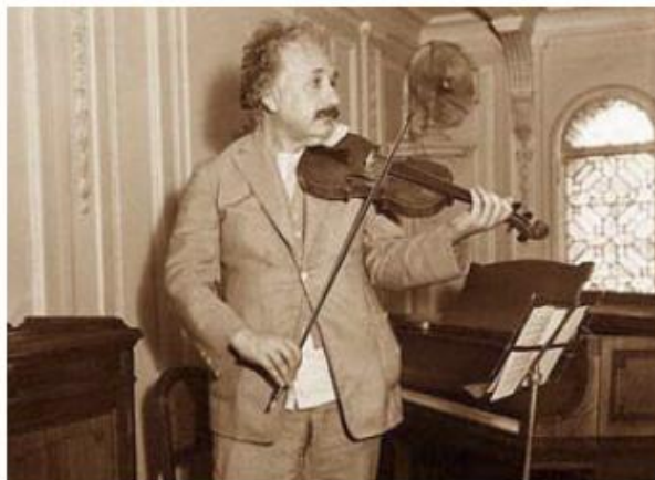
Stvaralaštvo u fizikalnoj znanosti ima korijene, kao Albert Einsteinovo korištenje svoje violine, u sposobnosti čovjekova uma u „Klasično umjetničkim načinima kompozicije na polju osebujno ljudske mašte“. Einstein ovdje prikazan u siječnju 1931.g.

U nehatnom popularnom mnijenju podrazumijeva se danas, kao naprimjer u jednostavnoj matematici, da postoji uvelike zanemareno suglasje između univerzalnih zakonitosti i onog što bi čovjek mogao pretpostaviti kao ishod prouzrokovan ali nepredviđen matematikom. Pogreška u takvim lažnim, no unatoč toga popularnim pretpostavkama, ovisi o vjerovanju u naizgled instinktivnu, relativno jednostavnu, ali krivo pretpostavljenu kao zakonitu, suglasnost osjetilnog zapažanja smatranog kao „točnost osjetila“ sa zakonitim redom stvarnosti svemira kojeg nastanjujemo.