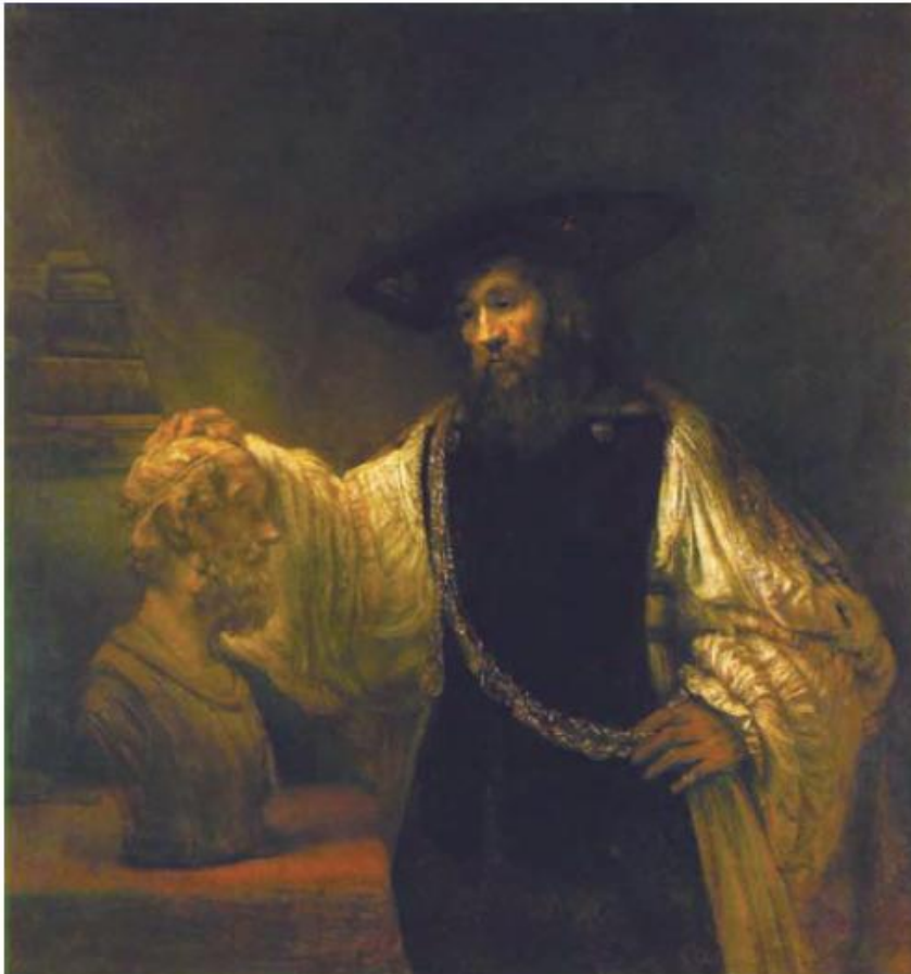
Načelo ironije, čija srž je metafora, bit je sjena koje bacaju stvaralačke moći uma. Na slici, u Rembrandtovoju slici „Aristotel promatra poprsje slijepog Homera (1653.). gdje su stvarno Aristotelove oči? Tko ustvari vidi?

ulaganja fizičkog kapitala i gustoće protoka energije, nužnih u spriječavanju procesa trošenja odnosno opadanja u svakom nastavljanju ustaljene razine gustoće protoka energije djelovanja, po glavi i po četvornom kilometru, u svakom gospodarstvu.