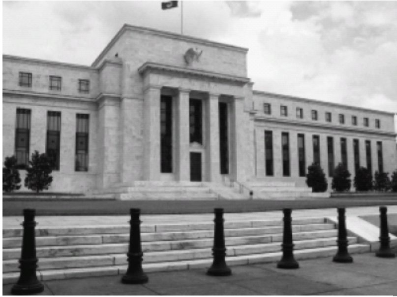
Prvi korak nužan za spašavanje Sjedinjenih Država od gospodarske katastrofe sadrži Saveznu Priču [Federal Reserve]: Proglasiti njen stečaj, i staviti je pod zaštitu pretvorivši je time u de facto nacionalnu banku. Ovdje, sjedište stožera Fed-a [Priču] u Washingtonu, D.C.

Mjere nužne za spašavanje SAD od kobne gospodarsko/monetrano financijske katastrofe, spadaju pod dvije opće kategorije. Prvo, razmatramo nužno djelovanje vlade SADA u neposrednom interesu nacije. Drugo,