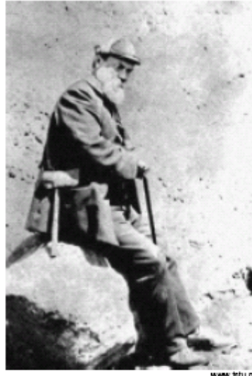
V.I. Vernadski, ruski znanstvenik, bio je vođa razvoja moderne dinamičke metode znanosti za razliku od neuspjelih mehaničko statističkih metoda u kartezijanskom stilu. Ovdje Vernadski u ekspediciji 1910. meinos. rere, Vernadsky on an expedition in 1910.

Nažalost za većinu najpopularnija nastava moderne sociologije, političke teorije i ekonomskog planiranja uzima za pretpostavku redukcionističku ideologiju