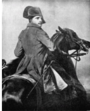
Napoleon Bonaparte, prikazuje u malom modernu vrstu fašizma koju je europska financijska oligarhija koristila kao prijetnju protiv američke tradicije.

Prema tome, Kolumbova plovidba 1492. ne predstavlja prenos takvog zla u obje Amerike. Radije, Kolumbo i Torquemada primjer su sukoba između suprotstavljenih sila dobra i zla unutar same Španjolske tog doba. Utapanje moderne Europe u krvi istrajnog sukoba iz razdoblja od 1492. – 1648. ključ je poimanja sukoba koji je bio jedini istinski ocean podjele utemeljenja naše vlastite ustavne republike od poštasti