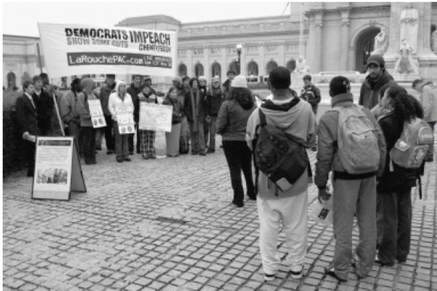
LaRouche-ev Pokret mladih, elitna skupina odraslih mladih ljudi, igrala je središnju ulogu u pobjedi Demokrata na izborima 7. studenog. Ovdje, okupljanje LYMa na političko djelovanje na Union Stationu u Washingtonu, D.C., nakon izbora.