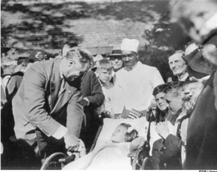
FDRove hitne mjere u cilju izvođenja američkog gospodarstva iz katastrofe bile su u skladu s načelom agape, brižnost puna ljubavi prema svim građanima počevši s onima koji najviše pate. Ovdje, FDR je uhvaćen u Warm Springs-u, centru za polio kojeg je utemeljio, pozdravljajući se s bolesnim djetetom.

protekcioniističkih mjera. Zlobni idioti opisali su te mjere kao da u biti podupiru lijeve na užrb energičnih, no ti su kritičari bili ili glupi ili su jednostavno lagali, kao liberali grabežljivih oligarhijskih sklonosti ili kao što su njihovi demagoški stvarni slugani ili koji su to željeli biti, ubičavali činiti. Ustvari nastojanje tih „protekcioniističkih“ reformi bio je sustav neizbrisivo dosljedan nakani našeg Saveznog Ustava, sustav kojiput zvan „pošteno ['fer'] trgovanje“.