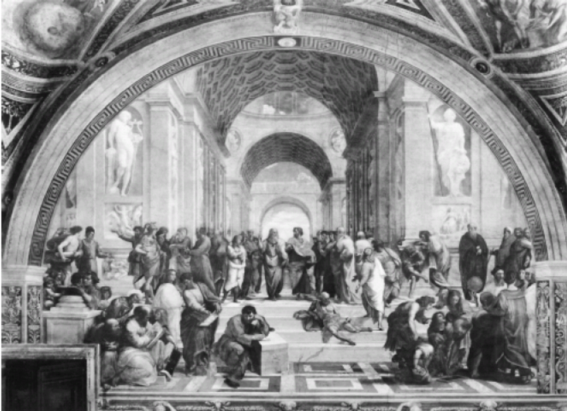
Renesansa sredine 15. stoljeća sa središtem u Italiji predstavljala je odlučujući pomak i prouzrokovala pravu eksploziju umjetničkog i znanstvenog stvaralaštva. Ovdje, „Atenska škola” renesansnog umjetnika Rafaela.

Ljudsko stvaralaštvo, kad ga se ispravno definira, izražava kao eksperimentalno prepoznatljiv suvereni oblik ponašanja pojedinaca, nego ono također daje kvalitativnu „energiju” u ontološkom smislu „pokretne snage”, svim velikim, pozitivnim promjenama u smjeru razvitka unutar društvenih procesa kao takovih.