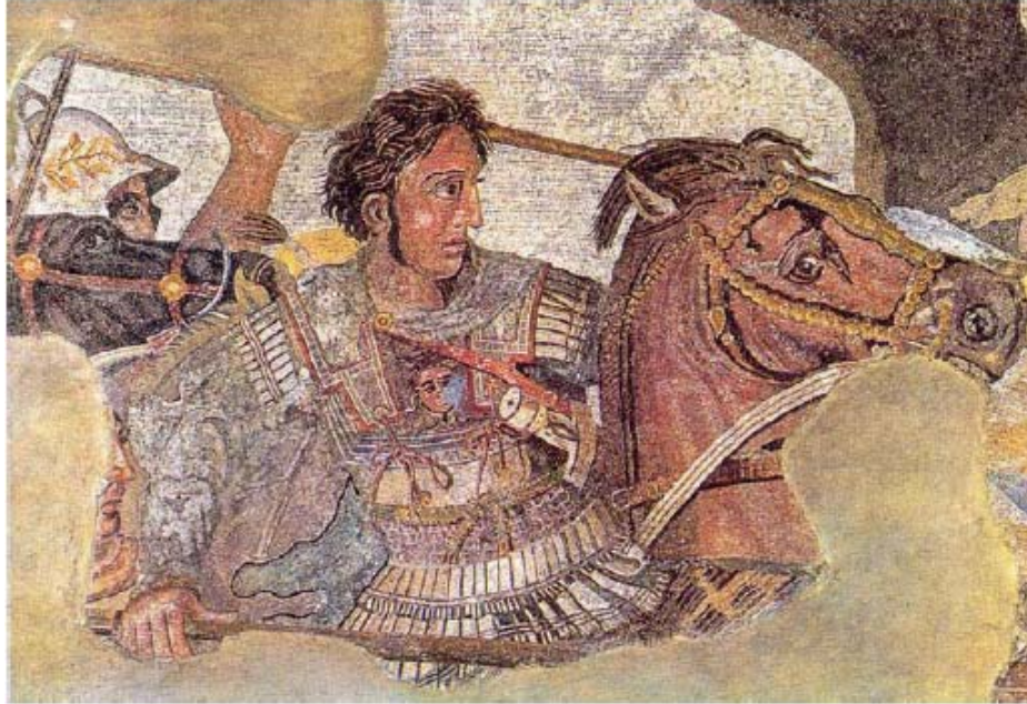
Aleksandar Veliki, neprijatelj Aristotela, umoren je 323. G. prije Krista, što je dovelo do podjele vlasti koja je konačno dovelo do uvođenja Rimskog carstva. Gore, mozaik iz Pompeja u Napuljskom nacionalnom arheološkom muzeju.

Mletačkog carstva, a to je anglo-holandsko-saudijsko financijsko carstvo današnjice, carstvo okota zla Paola Sarpija koje je sasvim pogrešno usvojilo ime „Britansko“, a zapravo bi trebalo biti „brutalno“—[ igra sličnozvučnih riječi - British/brutish ]. 19