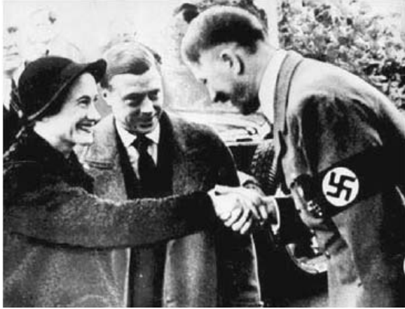
Adolf Hitler pozdravlja vojvodu od Windsora, kasnijeg kralja Edwarda VIII i njegovu ženu Wallis Simpson, studeni 1937. Edward je vladao samo jednu godinu prije abdikacije 1936.g. Albert Speer je kasnije citirao Hitlera: „Da je ostao, sve bi bilo drukčije. Njegova abdikacije bila je velik gubitak za nas.“

soja, a također ju je, ogoljenu, izrazio John Meynard Keynes u svojoj priznatoj izjavi nakane 1937.g. Obrascu 1930.-ih prethodila su nastojanja koja je također London uveo u SAD kroz Wall Street i srodne krugove, a Wall Street i ti krugovi, glavni protivnici Franklina Roosevelta, poticali su simpatije prema Mussoliniju i Hitleru tijekom 1920.-ih i 1930.-ih. Nije bilo iznenađujuće kad se taj obrazac nastavio kroz čitave 1930.-te sve do trenutka kad se Italija pridružila „Blitzkrieg“-u u Francuskoj. Taj je moment Winston Churchill Britanije vješto iskoristio i napustio svog talijanskog ljubimca, fašističkog diktatora Benita Mussolinija.