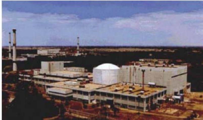
Reaktor Kamini u Kalpakkamu, na indijskoj jugoistočnoj obali, jedini je torijski nuklearni reaktor na svijetu, koji je u funkciji. Ogromne zalihe torija Indije čine ga odličnim odabirom za podmirenje zahtjeva nacije za energijom.

Osovina povećanja potencijalne relativne gustoće napučenosti su, u slučaju proizvodnje i radnika u toj proizvodnji, napredovanja u usvojenom saznanju univerzalnih fizičkih zakonitosti. Osovina relativne produktivnosti, po glavi i po četvornom kilometru sektora gospodarstva, leži u povećanju produktivnosti, i očekivanih godina života i zdravlja okružja u kojem se proizvodnja odvija.