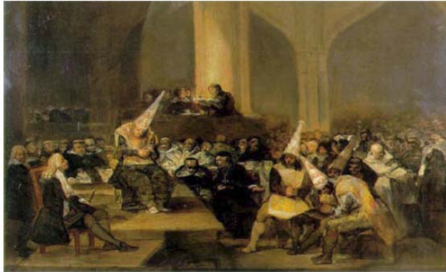
„Sudsko vijeće Inkvizicije“ Francisca Goye, 1812. Vjerski ratovi koji su se širili Europom od 1492. do 1648. bili su namjerno izazvani da bi izbrisali državu naciju koja je nastala u vrijeme Renesanse.

Europe između sjeverne (uglavnom protestantske) frakcije i južnog (uglavnom katoličkog) sloja, uklapajući i druge elemente tvoreći sjevernu frakciju, koja što je Nizozemska i njene francusko-govorne švicarske elemente, s protivničkim snagama koje je vodio Martin Luther King. Nakon Koncila u Trentu, Zorzijevu ulogu preuzeo je, u većim razmjerima, utemeljitelj modernog liberalizma, Mlećanin Paolo Sarpi.