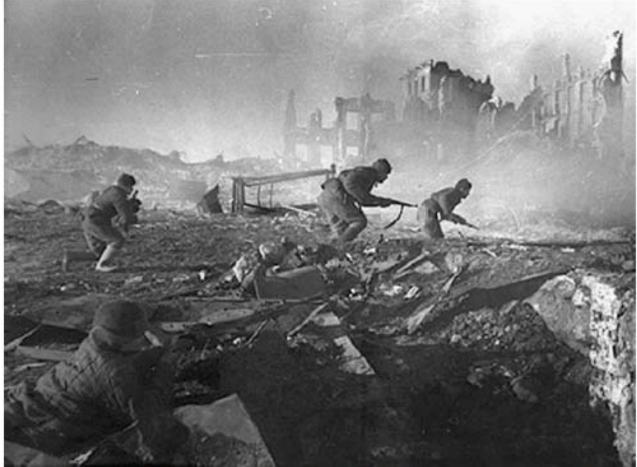
Oštre borbe na ruskoj fronti: Staljingrad 1943. Britanci su planirali izgraditi nacističku Njemačku u svrhu rata međusobnog istrebljenja sa Sovjetskim Savezom, no njihov proračun se izjalovio.

No kad je Wehrmacht pregazio Francusku, isti London koji je podupirao Hitlera sve do Wehrmachtova prodora preko Francuske, i isti britanski krugovi, koji su stvorili Hitlerov njemački režim u nakani uništenja i Njemačke i Rusije u međusobnom sukobu i ratu, odlučili su dotrčati Sjedinjenim Državama po pomoć u svrhu sprječavanja, kao što je Walter Lippman u to vrijeme pisao, onog što su smatrali Hitlerovim nezahvalnim ciljem progutati Britaniju prodorom kroz sjevernu granicu Njemačke.