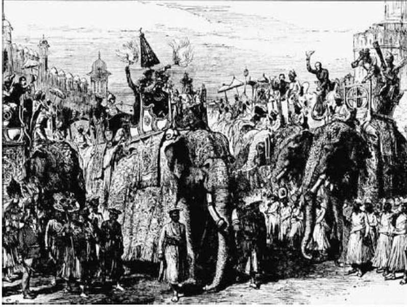
Britanski princ od Walesa, Edward Albert (kasnije kralj Edward VII), u posjeti svojim dominionima u Indiji, 1876.—godina Američkog Stoljetnog sajma.

američko političko gledište s Rooseveltovog Bretton Woodsa na Keynesov.