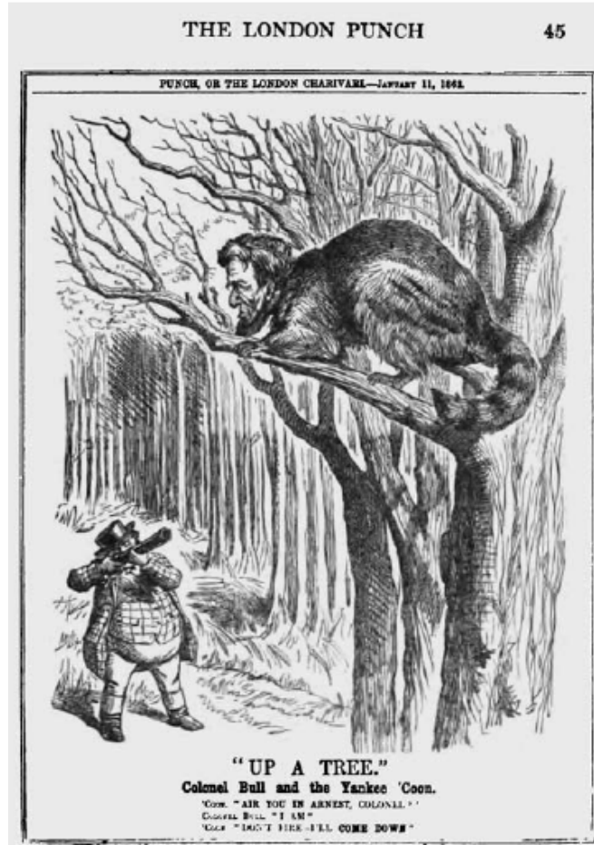
Instinktivna mržnja britanske oligarhije prema Abrahamu Lincolnu vidi se na ovoj karikaturi u The London Punch, od 11. siječnja 1862.

zbog svojih već odlučениh ciljeva za dugoročni raskol Sjedinjenih Država po uzoru na već neuspjeli pokušaj lorda Palmerstona podupirujući Londonom stvorenu marionetsku državu Konfederacije.