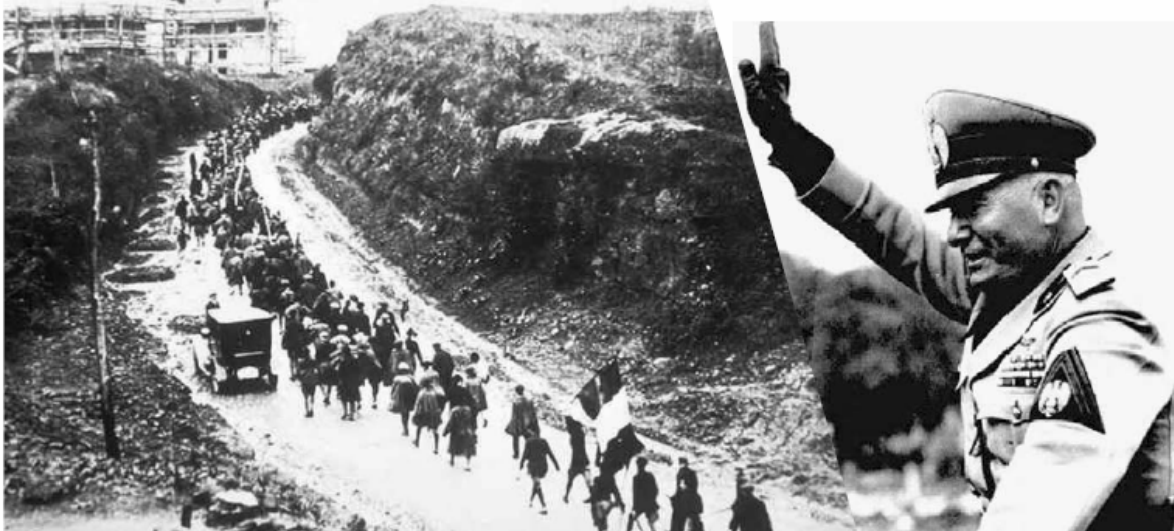
Benito Mussolinijev Marš na Rim, 1922.

"Nisam si mogao pomoći da me, kao i tolike mnoge druge ljude, ne očara signor Mussolinijevo blago i jednostavno ponašanje kao i smireno, ravnodušno držanje unatoč tolikih opterećenja i opasnosti.... [Italija] ja ponudila nužni protuotrov ruskom otrovu. Odsada svaka će velika nacija imati na raspolaganju konačno sredstvo zaštite protiv kanceroznog rasta boljševizma." — Winston Churchill , govor u Rimu 20. siječnja 1927.